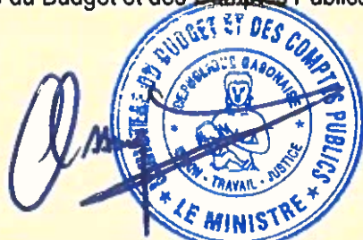
Sosthène OSSOUNGOU NDIBANGOYE

Le Ministre du Budget et des Comptes Publics